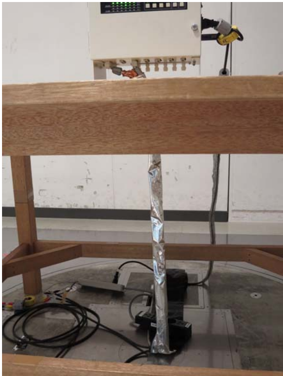
写真4 信号線にジッパーチューピング

3.3の結果に比べて90MHz付近（約800mV 530mV）は変わらず。130MHz付近（約800mV 650mV）は若干改善された。