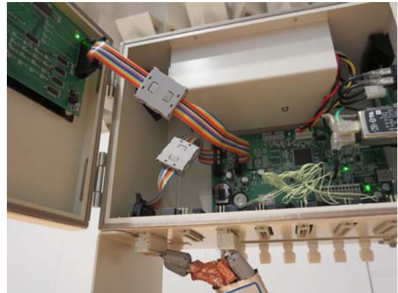
写真5 盤内フラットケーブルに対策

筐体自体はほとんど鋼板で覆われていて、唯一前面切りかけの部分に表示パネル及びその基板がある。そこから内部の基板に向けて電源や信号線がケーブルで結ばれている。