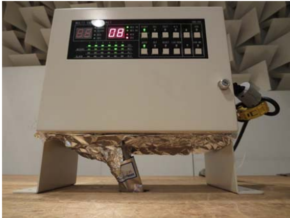
写真6 3.4の状態でコネクタ部アルミ箔シールド