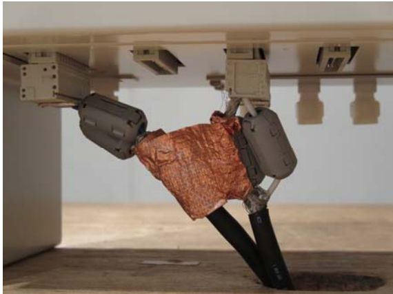
写真3 信号線対策、シールド線共通接地