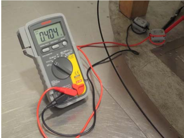
写真1 デジタルマルチメーター

接地。接点入力信号は全てオープン。アナログ出力信号は4-20mAで4mA出力、100Ω抵抗を介して400mV出力とする。その電圧を写真1のとおりデジタルマルチメーターで測定して放射無線周波数電磁界イミュニティ試験の影響を確認する。ロガーのような連続的な記録計では試験の影響を受けてしまい、数字のバラつきが被測定物の影響なのか、記録計の影響なのかを切り分けられなかった。前記試験において安定した実績のあるデジタルマルチメーターによる目読とした。接点出力は信号端を10kΩの抵抗で接続して、0.1μFを介して接地した。